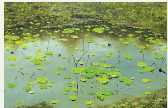
徐世混 《荷塘风景写生》