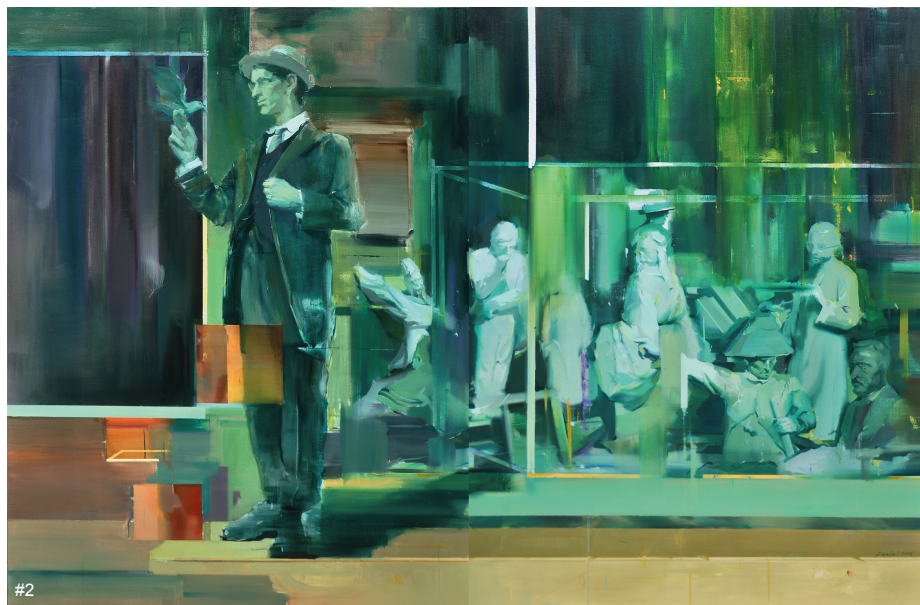
2 樊磊 进化·链接——自由 布面油画 260×170cm 2015