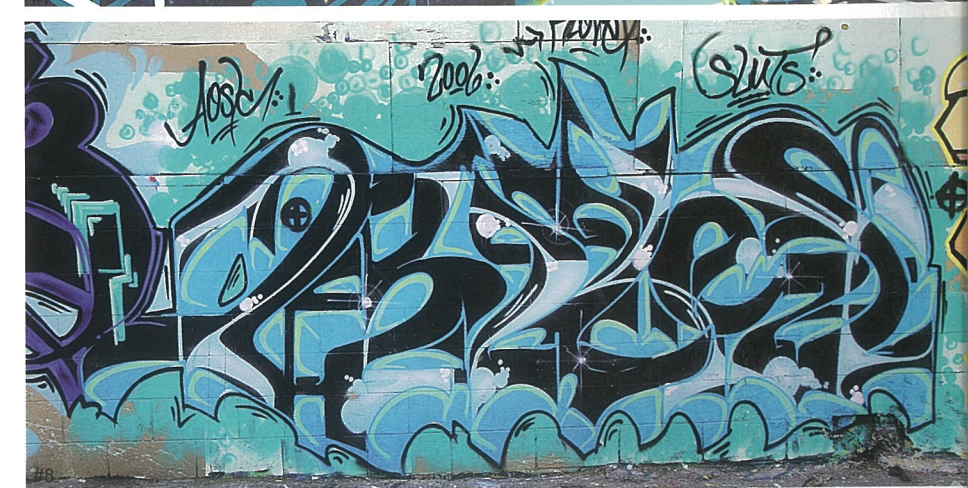
1 #1-8 英文字母和单词成为涂鸦艺术的典型图式