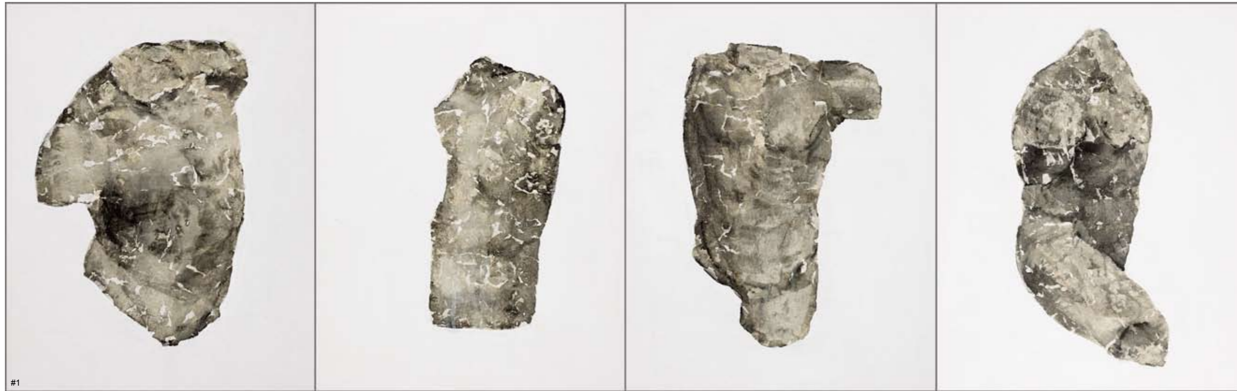
1 刘伟 存在·文明NO.2 75×60cm×4 2016