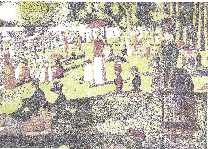
#1 Floating Floras Series No.05 油画 俸正杰 #2 CMYK—大碗岛上的星期天 布面丙烯 杨冕 #3 人类后风景之三 套色木刻 戴政生