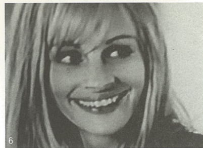
1、杂混 摄影 沃尔特斯 2、伊蒂斯的讲述 摄影 沃尔特斯 3-5、重来 摄影 伊萨克·朱蒂安 6-7、无题 摄影 伊萨克·朱蒂安