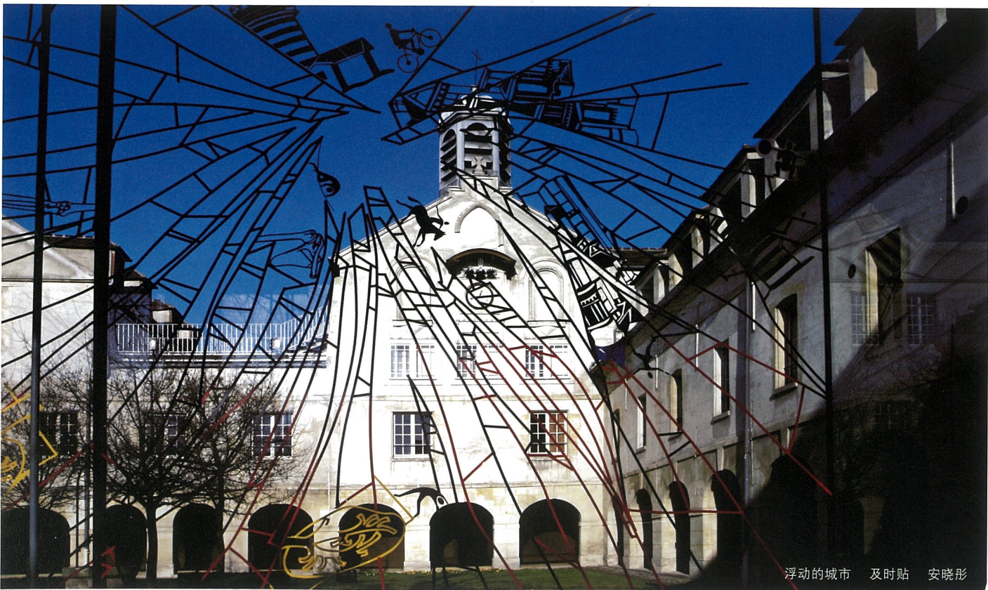
浮动的城市 及时贴 安晓彤