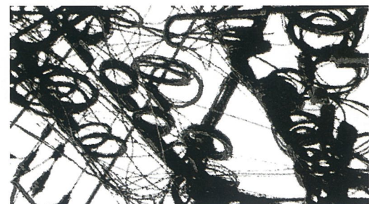
都市·线 水墨综合媒介 董小明

2008年12月5日开始举行的“第六届深圳国际水墨双年展”是由文化部批复、深圳市政府主办、深圳画院等专业机构承办的“深圳国际水墨双年展”是常设性、国际性大型水墨艺术展示活动，以弘扬水墨画艺术传统、促进东西方文化交流和推动传统水墨走进当代为宗旨。“第六届深圳国际水墨双年展”由“笔墨·都市”、“新媒体·水墨·都市”、“深圳故事”和“日本现代水墨”四个单元组成，四个单元分别由严善錞、鲁虹、陈湘波、陈君、杨晓洋及日本京都现代美术馆馆长岩城见一策划，共邀请了100余位国内外艺术家参加。展览将持续到2月8日。