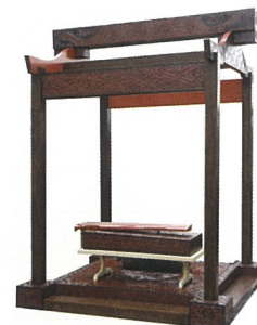
琴亭 漆器 谢震