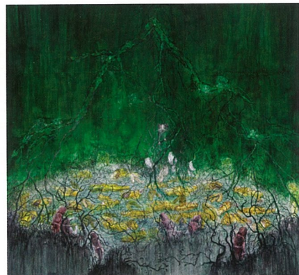
白光 布面油画 刘玉洁

《看望未来——四川美术学院油画系第16届学生作品年展》于2009年1月8日至16日在重庆美术馆举行，这不仅是教学的全面呈现和总结，也是一次年轻艺术家的集体汇演。展览由油画系“当代艺术教育文献库”负责组织，希望通过这样的一个独立的学术机构进一步将教学与学术活动细化、专门化。同时围绕展览设立的五个单元“基础、绘画、装置、影像、摄影”也涌现了大量的优秀作品，为展览设立的“顶层艺术奖学金”评选出一等奖2人，二等奖5人，三等奖6人；文献库学术提名奖5人，特别奖1人；显现了川美学子多元的视角和丰富的创新力。