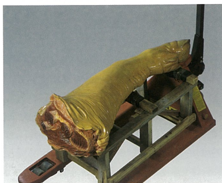
猪脚 雕塑 李占洋

2009年1月24日至3月28日，李占洋个展“性·情”在瑞士卢森的麦勒画廊与观众见面。熟悉艺术家的人都知道，李占洋本来就是一个性情中人，在他的艺术创作中，这也是显而易见的。但是，艺术家的创造力和艺术热情，并仅仅简单地建立在“性情”之上，同时也注入了艺术家自己对于历史和文化的理解。李占洋善于从日常生活中提炼出自己的言说方式，并以另类的视角向我们呈现了他对于艺术史的解读。而细腻的写实技巧也进一步彰显了作品的感染力。