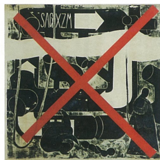
肖正在构成—工业是否也可能成为宗教 布面油画 肖谷迷

2008年12月5日至2008年12月21日徐汇艺术馆将举行“大时代之光——上海青年美展30年回顾展”。本次展览是由卢缓、朱曦、唐丽青、庞飞、王欣共同策划的，是为纪念改革开放30周年而由徐汇区文化局和刘海粟美术馆联合举办的。作为30年来中国美术展览史上影响最大、持续时间最久的展览之一，上海青年美展迄今已举办了11届。从首届伊始，上海青年美展就成了一扇通向美术殿堂的大门。从里面走出的不少艺术青年，若干年后已是如今上海画坛的领军人物。