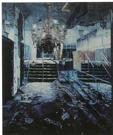
梦幻客轮 布面油画 袁远