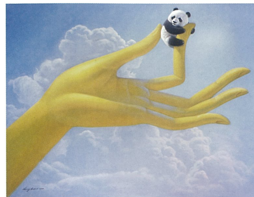
捉拿 布面油画 张奇开

2009年1月11日，上海顶层画廊举办“时空中的谜语——张奇开个展”，画展集中展出了著名艺术家张奇开近年将熊猫作为主角的21件油画作品，比如《不让你瞄准》、《谁都免不了有梦想》等等。张奇开说“这些作品完整呈现在当代艺术中已经长久缺失的技术美学，把浪漫主义和理性主义巧妙融合为一体，借助强烈的视觉效果来呼唤唯美主义精神的回归”。艺术家以熊猫为艺术符号叩问人类当下的处境。展览将持续到3月11日。