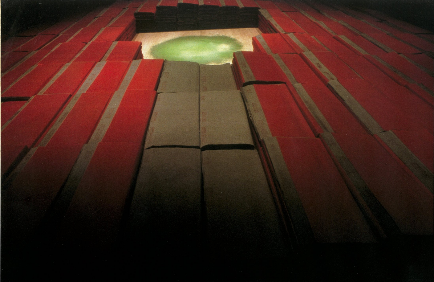
展览期间绿茶粉洒落于装置中心