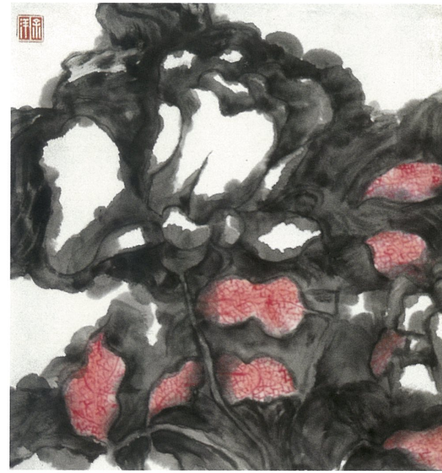
暮色 余洋 国画