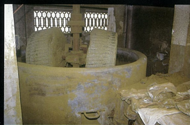
绿茶叶在石磨中碾成茶粉