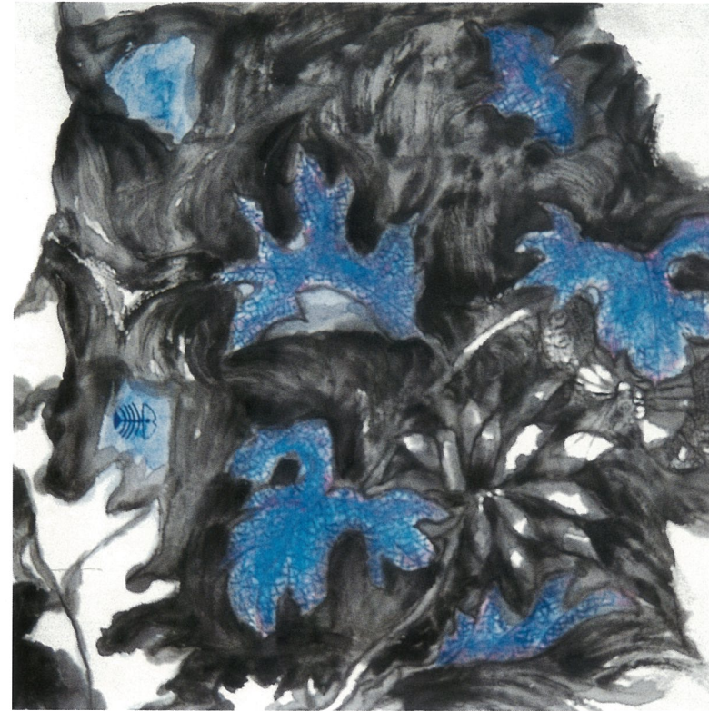
蝶恋 余洋 国画