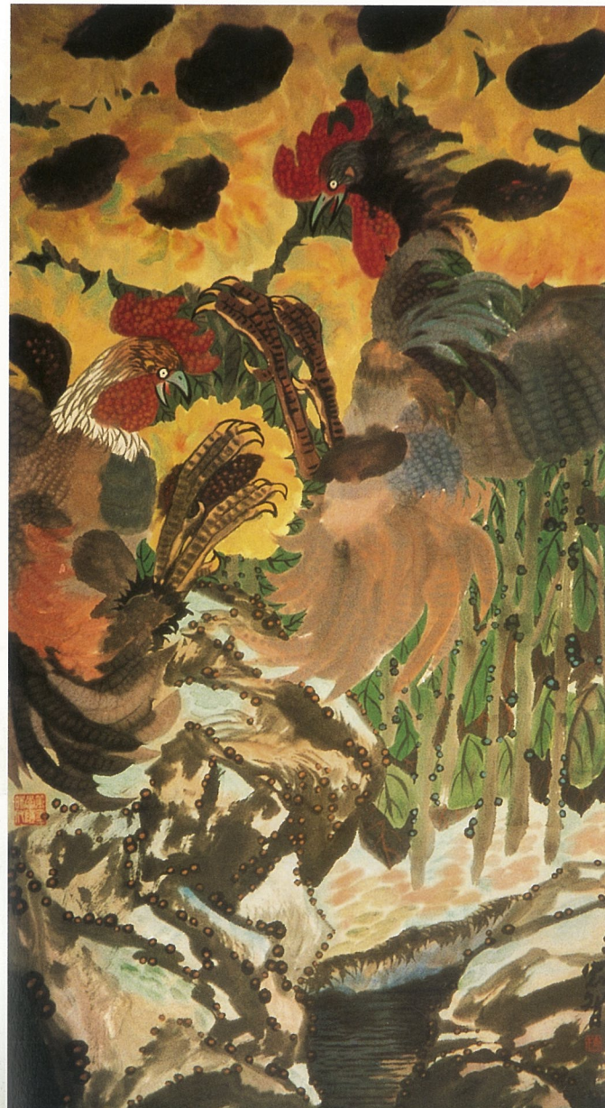
斗鸡 梅忠智 国画