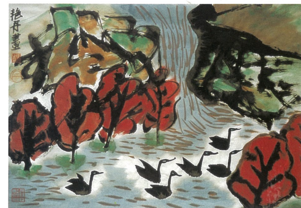
自在 李艳丹 国画