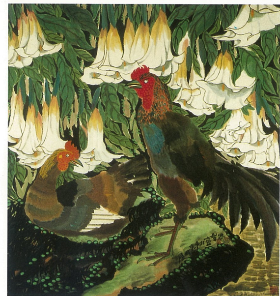
对语 梅忠智 国画

术的人的生存空间就显得较过去宽松得多。这首先体现在当代人对具有历史厚度和底蕴的花鸟画艺术的理解被割裂地加以看待、并采取割裂方式进行继承与研究，就方式和手法而言，已经大大地超过了过去任何时代的规范程度和具有了前所未有的自由度。随着科技文化的高度发展，过去的人们很难想象和触及到的文化艺术融会贯通已经异乎寻常地在全球范围实现了，这样的相互补充和相互借鉴，强烈地冲击着形成并发展在农业经济基础之上的、在长时期内相对封闭的中国花鸟画艺术。正是因为各种文化艺术的交融变通日益频繁，传统文化艺术与现、当代文化艺术的矛盾也愈来愈深化、割裂与重组的可能性也越来越大。所以我们才必须要对中国花鸟画艺术进行由里及表、由浅入深的反思与研究。