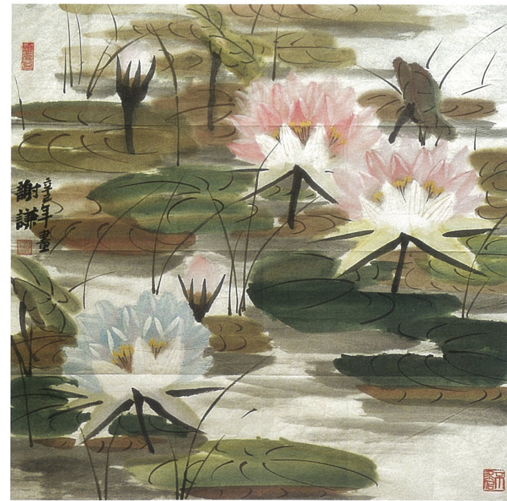
睡莲 谢谦 国画