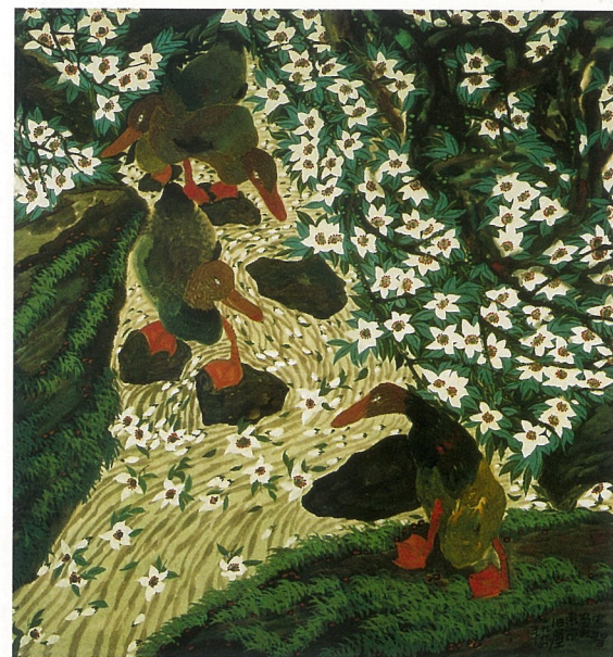
桃花流水 梅忠智 国画

什么是中国花鸟画艺术专业硕士研究生的素质，的确包含着极其复杂的因素与深层的内涵，因为中国花鸟画本身所涵盖的历史文化内容及其演变发展，在各个历史时期所呈现出来的多重绘画特征及其时代意义的种种知识，大而言之都应归属为他们的素质；就花鸟画艺术的绘画要素而言，诗、书、画、印、工笔重彩、泼墨写意、古代壁画、民间年画、古典文学、戏曲、建筑、雕塑、工艺、中国人特有的审美特性与习惯、宇宙万物通过中国文化和中国美学所衍生出来的独特审美观念……等等，这些也都应当是他们的素质。但是，随着时代的发展变化，这些素质的含义已经在上述的基础上增进了新的内容。因为传统的花鸟画艺术对画家的要求和古代中国画家养成的社会历史环境与时代要求已经发生了根本的变化，用今天的话来说，就是研习中国花鸟画艺术的人的生存环境和人文环境已经不同于过去。如果说传统形态的花鸟画艺术对研习它的人的要求和规范只是局限在特定的空间、与相对统一的艺术准则之下具有严密的程式规范、对创新有所压制的话，那么，今天研习花鸟画艺