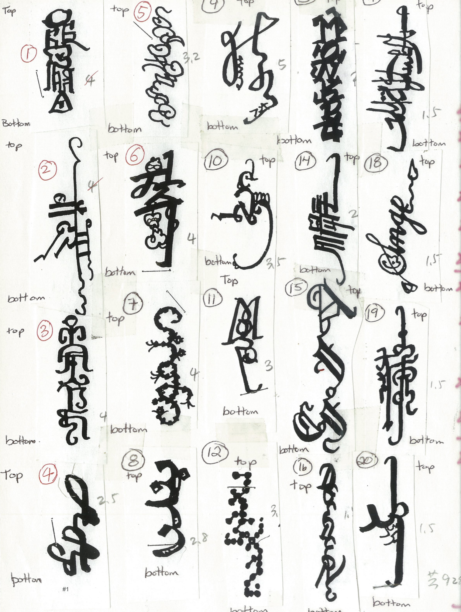
#1 猴子捞月 装置 徐冰 #2 天书 装置 徐冰

另外还有一点很重要，它本身含有一种和观众的特殊的沟通方式。事实上最后你会注意到在我的作品中所使用的很多方法都是中国的、传统的、智慧的方式。这不是说我有智慧，而是中国传统文化本身含有一些很智慧、很有意思的东西，这些东西包括咱们对待艺术的创造，包括咱们的一些生活态度、生活方式，同时也包括你和别人的沟通和交流的这种方