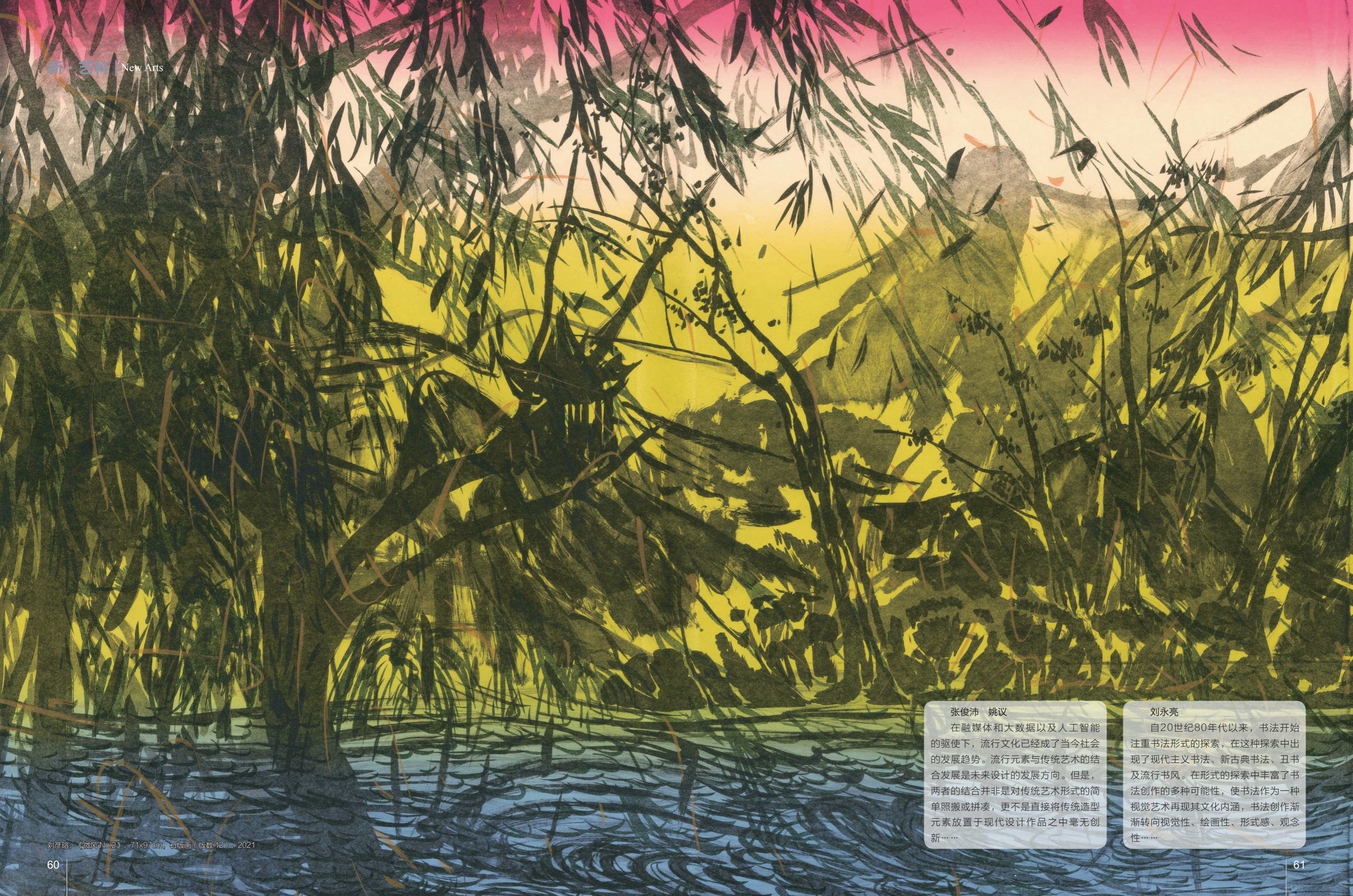
刘彦塔，《微风No.2》，71x97cm，石板画（版数：12），2021