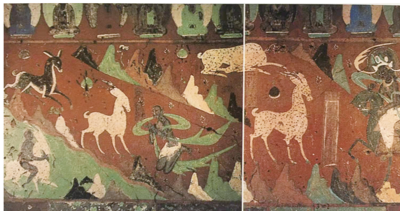
4. 莫高窟257窟鹿王本生故事

性的视觉效果展现在人们面前，而不单单是物化的简单复刻，使飞天的形象变得更为多样，搭配富有敦煌特色的传统色彩，使其更具装饰性(图2)。