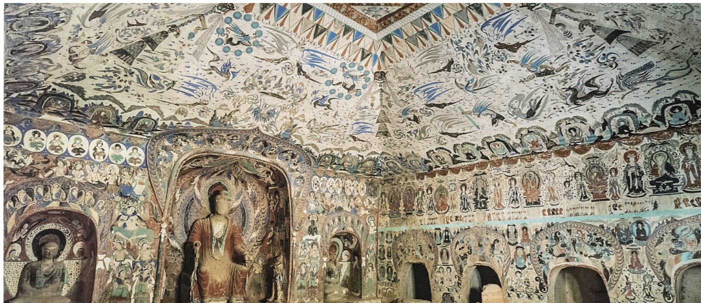
1. 莫高窟 285 窟