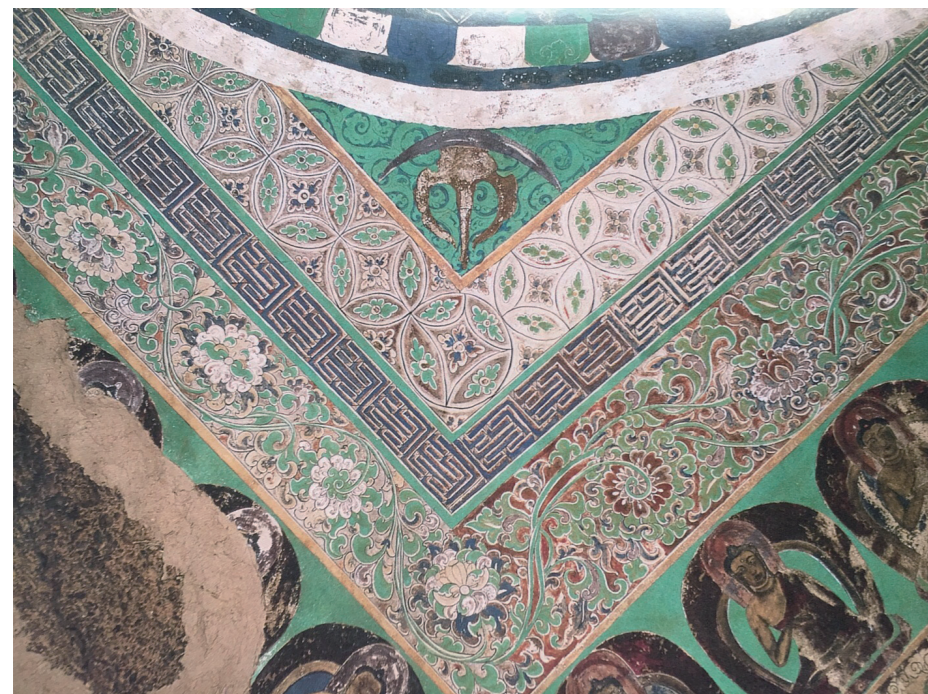
5. 榆林窟3窟藻井边饰(局部)

敦煌壁画的突出特征是图形元素的提炼和色彩元素的整合，从壁画绘制中不难看出，以“飞天”为例，古人尝试将飞天这一艺术形象提炼概括为点、线、面的造型基本元素，在设计创作表现时使其协调统一，这样就能通过不同的表现形式去概括它的形象特征。此外，在敦煌石窟中虽然每个洞窟的壁画在色彩表现上都多种多样，色泽明亮，但是画面效果却能做到和谐一致，在历史的发展进程中，人类常用色彩来表达情感，色彩是具有象征性和情感性的视觉元素。二者结合，由此便可使飞天的艺术形象以创新