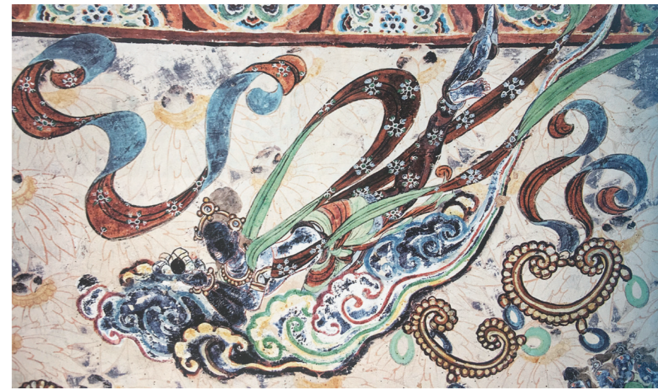
2. 莫高窟盛唐第 39 窟飞天

首先，网络信息的更新迭代和流行文化的兴盛是未来社会发展趋势的反映，人们可以通过各种方式了解世界各地正在发生或者已经发生的信息，使知识体系从之前的单一化向多元化发展。其次，网络流行文化也扩大了当代青年的交际范围，新的人际沟通和交流形式在网