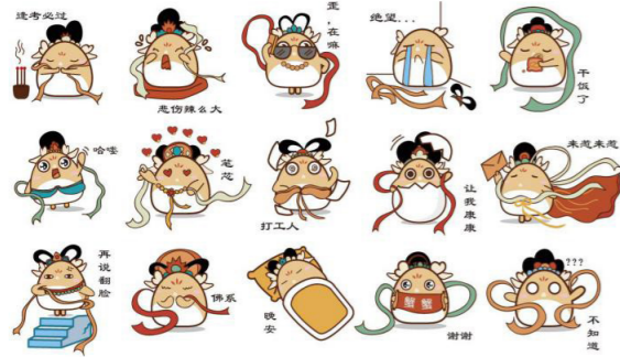
3. “墩墩的日常生活”表情包设计