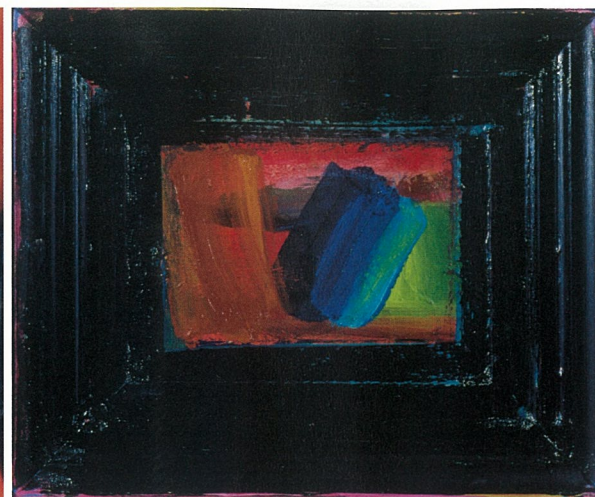
我的一件小事 布面油画 霍华德·霍奇金 (Howard Hodgkin) (1984 年特纳奖入围艺术家)