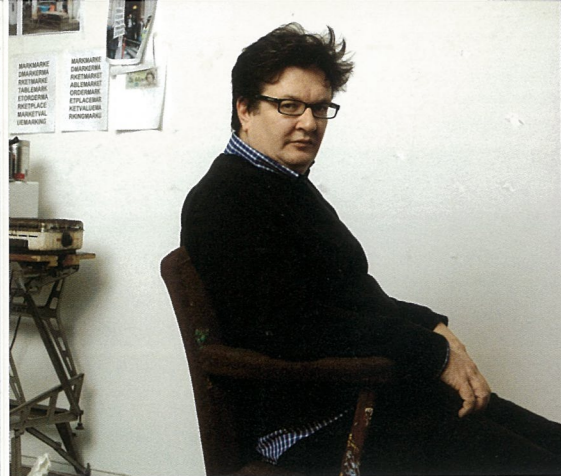
马克·渥林格肖像 (Mark Wallinger)