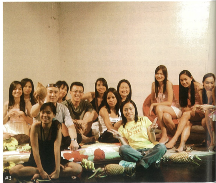
#1 温床之二 布面油画 刘小东 #2-3 温床之二 现场照片 刘小东