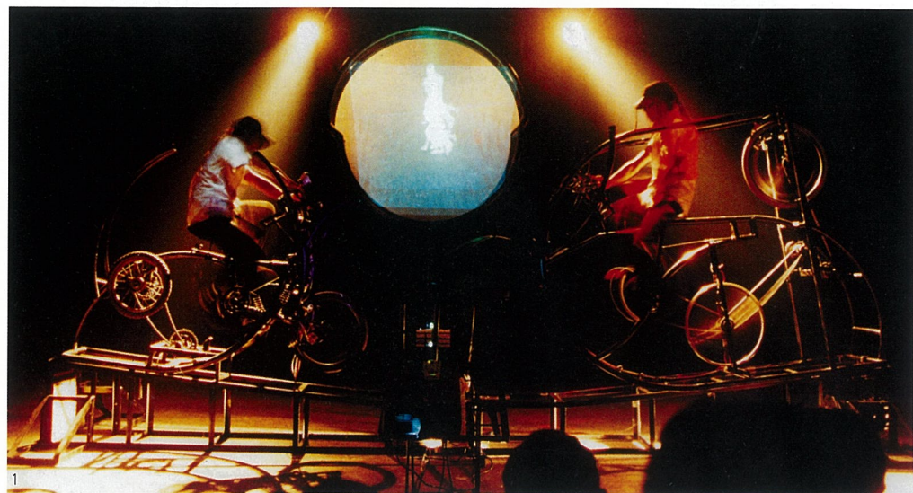
1、福岡三年展现场 2、Sereeterin Dagvadorj (蒙古) / 证明书 3、想象 装置 Chakkrit Chimnok (泰国) 4、睡眠中 行为艺术 明彦千春 (日本)

在太平洋优美的西岸沿线，日本列岛如同首尾相接的狭长裂隙，在这片汪洋的碧波中划下了一道不经意的弧度。然而，四面环海的孤独或吞云吐雾的火山，都没有让这个常年樱花盛开的国度走向落寞和封闭。恰恰相反，这个先天上曾被人耻笑的“地理儒”，在数千年的历史变迁中，却成为世界版图里一块不容忽视的弹丸之地。或许，正是因为地缘面貌上的局限，从来没有任何一个国家，像日本一样急于将它的触角向外延伸，将目光长远地眺向岛国的别处。今天，其九州北部的福岡亚洲美术馆和它所举办的福岡艺术三年展，已经在艺术领域显示了它在亚洲和世界范围内枝蔓纵横的深远影响。