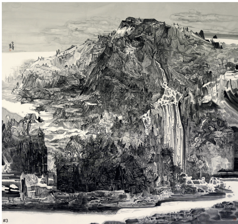
3 宋德志 静谧圣域 第九届黄原书画奖学金最高奖获奖作品

法的对象、方法。后来大家慢慢地通过黄原奖学金的价值取向，更加认可基础和传统的重要性，让同学们在学习的过程中耐住寂寞，坚持对基础的研习，而不是一窝蜂地搞创作。传统艺术需要承接传统的文化，创造。创作很重要，但对它要有正确的认识。基础类的作品评选，重点就是中国画和书法的基本功要解决的问题，比如说临摹敦煌壁画、进行山水写生，画面需要体现教学的规律和成果，如果基本功的问题没有解决好，那后续的创作是难以成立的。而创作类的作品评选看重的是独创性，对此我们没有排斥综合材料、新媒体类的作品。但同学们以这类作品参赛的人数不多，一方面通过多年的积累，大家了解黄原书画奖学金对传统和基础的重视；另一方面，侧重于媒介探索和创新性的其他评选活动很多，大家有更多的选择每个奖学金都有自身的特点，同学们参与评选活动时，会有比较明确的方向。