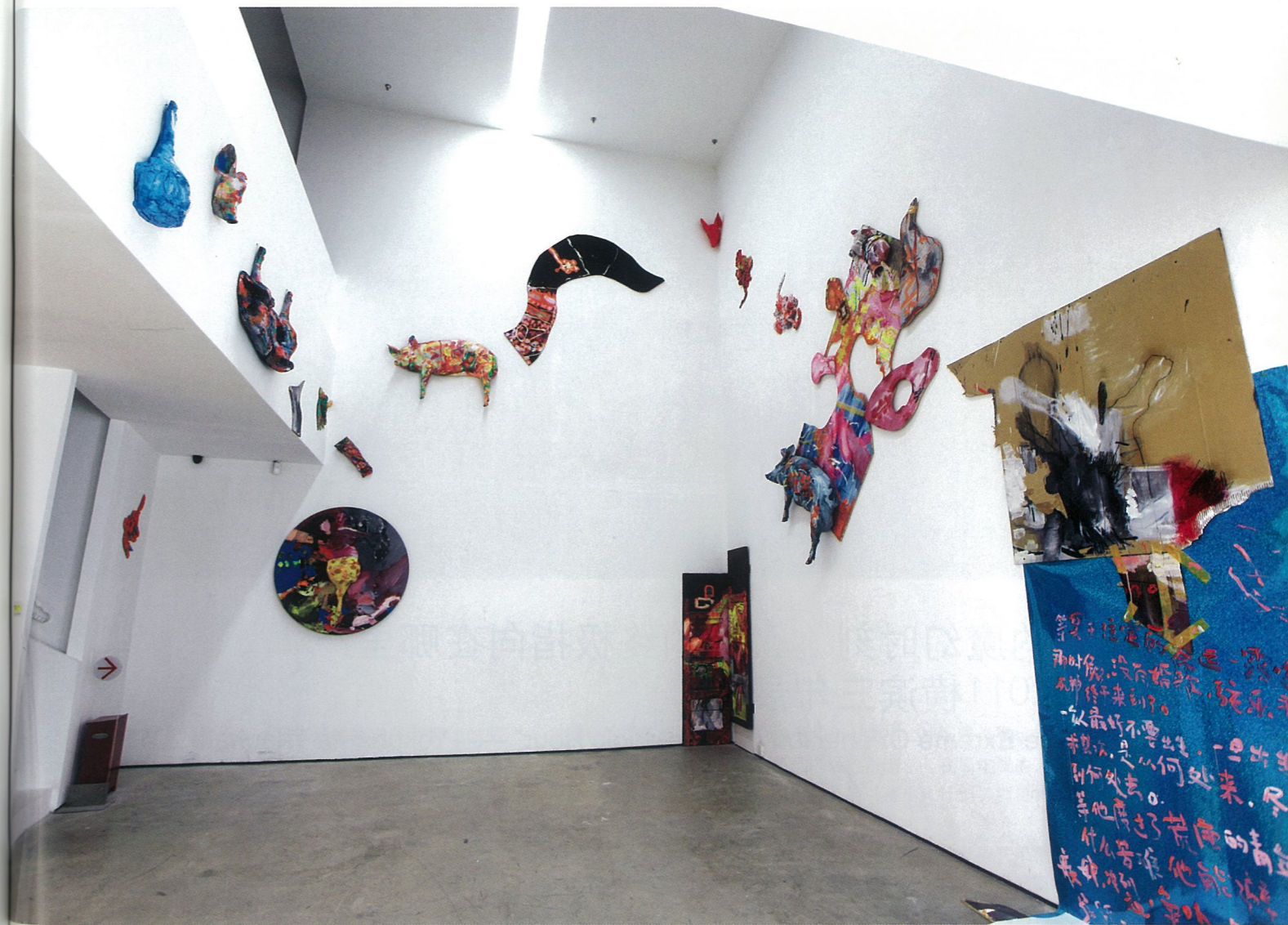
我还是不喜欢你 综合材料 杨述