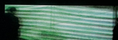
Inside of the flickering pop star jot down 流行明星的内部少量闪动下来