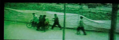
Becoming at this time dialogue 变成这次对话