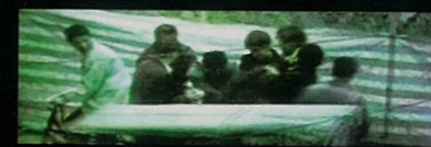
My heart surprised 我的心惊讶

I don't know what will be the future of new art media in China. Very popular may be, for so many young people are interested in it. But it's still not a big group working there, and greater efforts and investment are demanded. The new media has provided new possibilities, new stage and new direction for us, and I will throw myself into it.