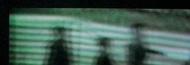
Inside of the flickering pop star jot down 流行明星的内部少量闪动下来