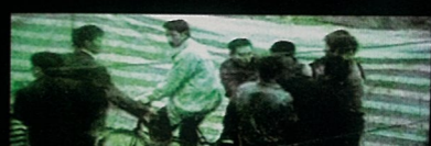
Already not at... 已经不在...