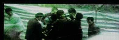
Becoming at this time dialogue 变成这次对话