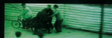
1234 Go 一二三四去