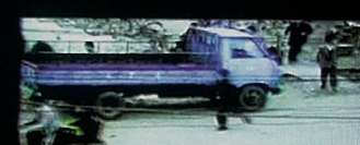
Happy swish swish 快乐嗖嗖