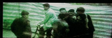
Gosh Gosh Gosh 唉 唉 唉