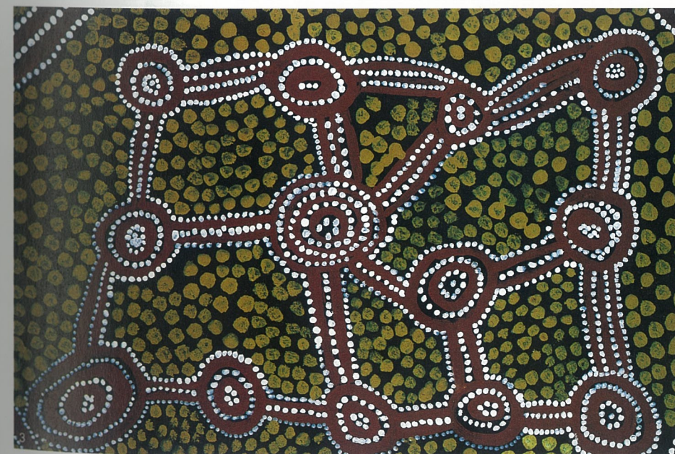
1、马布图·坦兹 油画 瑞纳·菲汀 2、无题 综合材料 布里奇特·瑞勒 3、循环气息 丙烯 诺塞佩基·尤尼特·提尤朴瑞纳