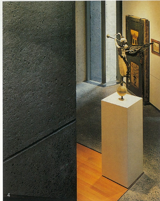
1-4. 画廊陈列着各式各样印第安风格的风向标。 5. 他那不平整的金属大门使其成为这条街上一道特别的风光。