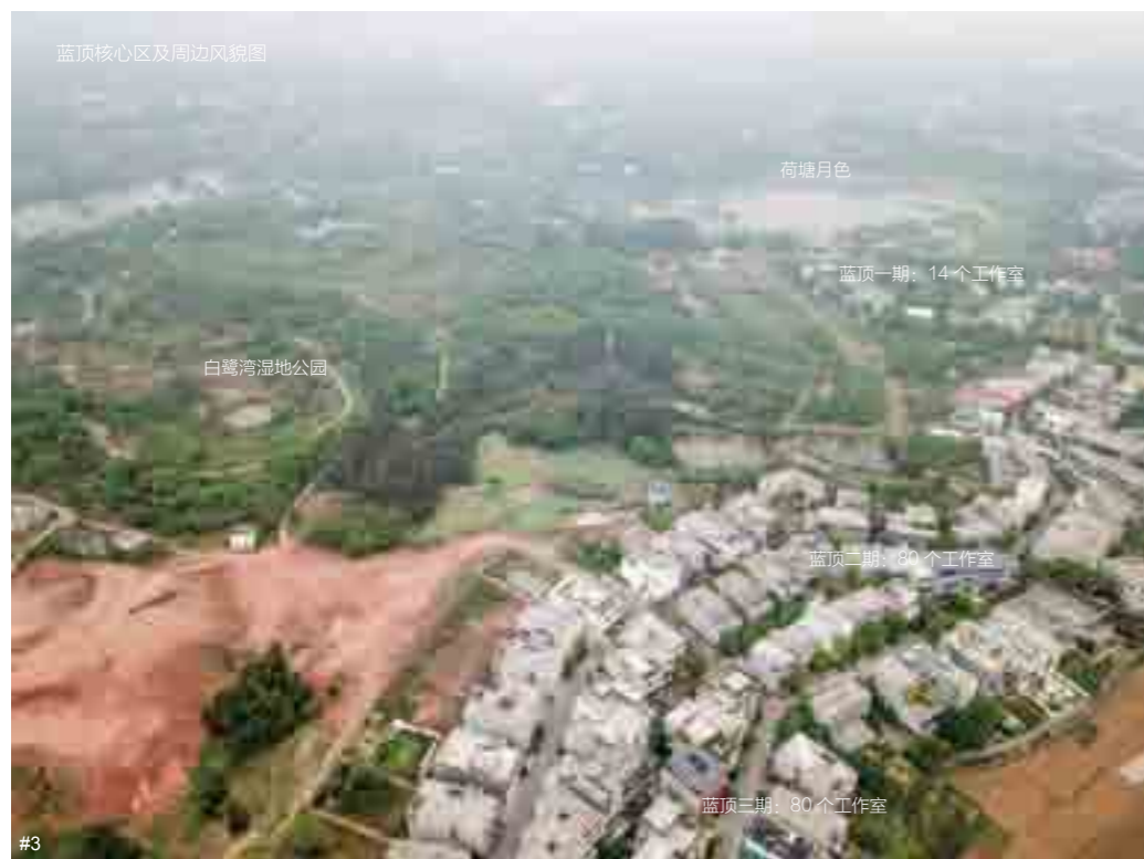
3 蓝顶核心区及周边风貌图 (蓝顶工作室现象跟二战后美国城市发展过程中的郊区化现象有何区别? 蓝顶工作室空间与卡地亚loft结构的别墅有何区别?)