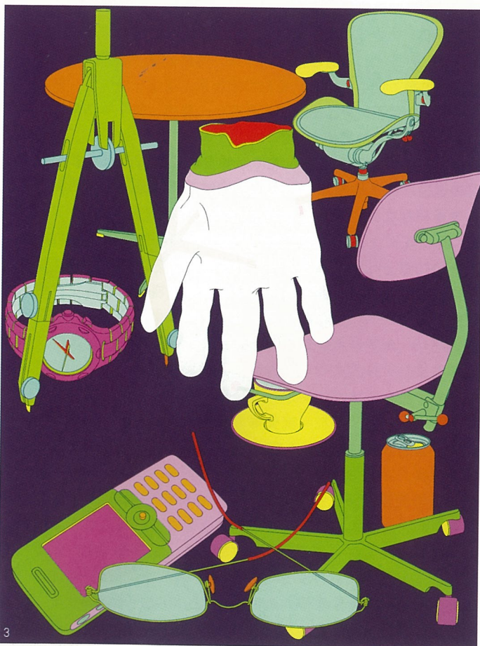
1-3. 来 电脑灯箱 迈克·克莱格·马丁 (设计与想象部分)