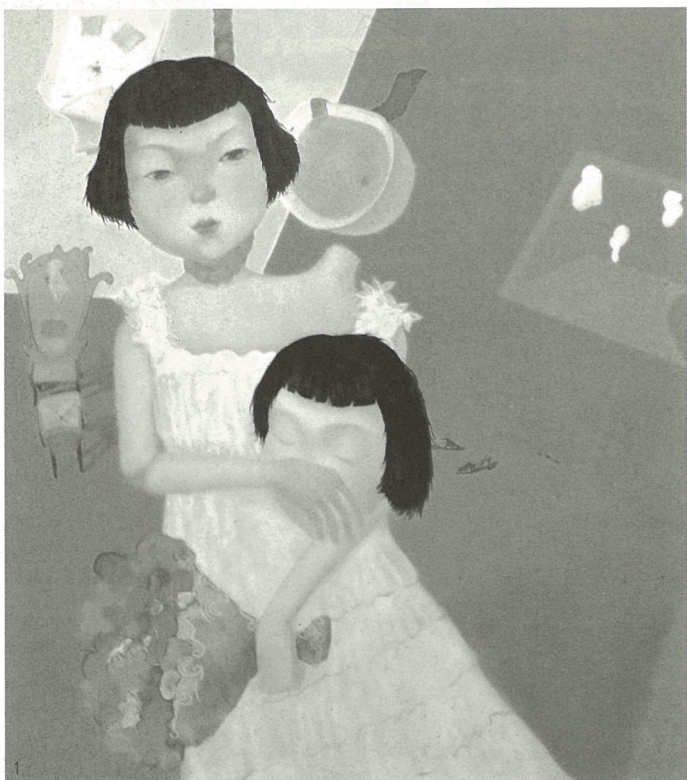
1. 高处的静 油画 杜文雯

都说重庆的夏天是火炉,我看川美毕业展油画展区的热度更盛。在国内油画市场一派大好的背景下,画商和画坛“星探”开始关注川美在校生的毕业展,不少学生的毕业创作以成千上万的不菲价格成交。皆大欢喜的结果成为展场内外的焦点话题,这是好事。想想以前,画家们一样饥饿,见面就问“吃了没有”,现在如雨后春笋般的画家们也可理直气壮地问声“卖了没有”。从“吃了没有”到“卖了没有”是社会的进步,虽说不一定是艺术的福音,却肯定是艺术家的福音。比“卖了没有”更吸引人的当数“签了没有”,毫无疑问,当不分配工作以后,能与画廊签约而衣食无忧差不多成了铁饭碗的代名词。于是在展览中或者其后不久,总能听到某人被签、某人卖了几幅画等振奋人心的消息,我也提醒学生们在作品标签上注明联系电话以免坐失良机。没有办法,学生也要吃饭穿衣,看看我们的毕业生怎么生活的,就能感受到毕业展的热闹是多么重要。少数画得较好的同学签约或卖了画能